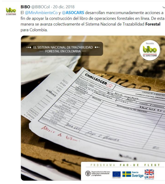
Imagen 1 Registro Vía twitter, construcción libro de operaciones en línea

El evento se compartió vía El Espectador y vía Twitter