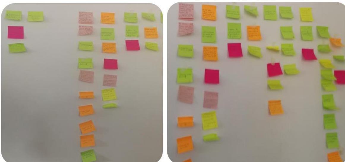
Foto 3. Registro de comentarios y conclusiones realizados por los asistentes al taller.

“pregunta si se podría categorizar las medidas y categorizar las empresas para el reporte pues es tiene dificultades en la presentación del informe anual”